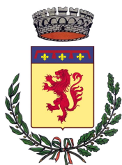
Comune di Loiano